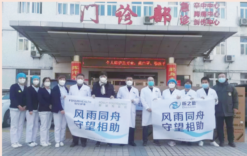
复星健康、复星基金会与华山中心医院交接物资

自西安疫情爆发以来，复星实时密切关注西安抗疫前线的最新情况。此前复星已在驰援武汉抗疫、全球抗疫和河南抗洪的过程中积累了充足的经验，复星基金会在此次西安抗疫中响应迅速，布局敏捷，从接到受助方需求到完成物资捐赠这一套流程规范流畅。复星发挥自身在大健康领域的专业优势，调配一切可利用资源，继续及时、精准地驰援抗疫前线，与西安人民共抗疫情。