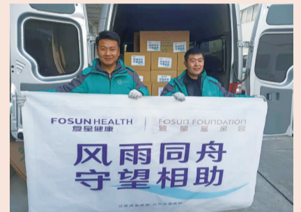
3000罐肾透析高蛋白低钠营养品送达西安高新医院

家封闭式管理医院的血透中心捐赠日常用品和营养品。在陕西省卫健委宣布指定西安高新医院为近期隔离管控人员的血液透析定点医院后，复星健康迅速行动，根据医院和患者的需求，紧急发出3000罐价值30万元的肾透析高蛋白低钠营养品，于26日上午送达隔离管控人员血液透析定点医院西安高新医院，用于帮助肾病透析患者补充营养。